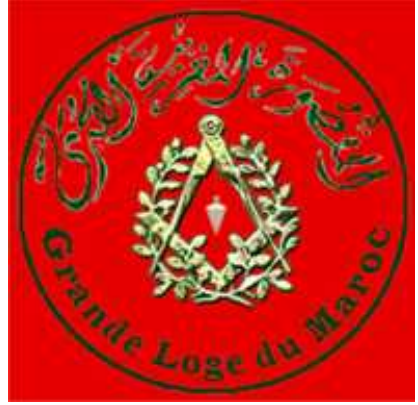
المقصورة المغربية الكبرى / محفل المغرب الأعظم